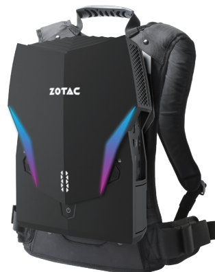
● VRGO 4.0

VRGO 4.0 背包式 PC 完全满足 VR 的性能需求，其图形处理核心基于 NVIDIA 专业级 GPU 设计，Intel Core i7 级别的处理器则负责各种任务调度，拥有支持热插拔的电池，理论支持无限制续航，人体工程学背包设计，超低负担，可广泛的运用于各类 VR 落地项目。